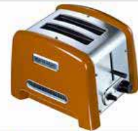
TOASTER TANGERINE KITCHENAID