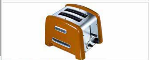
TOASTER TANGERINE KITCHENAID 259€